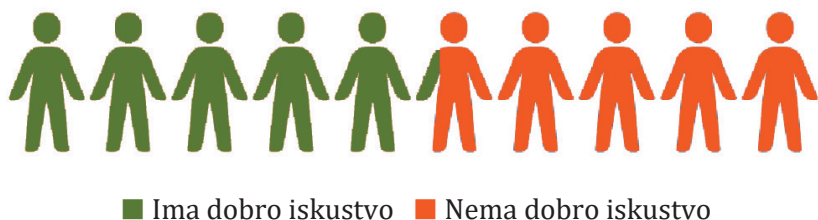
Grafik 8: Vizuelni prikaz rezultata u odnosu na dobro iskustvo u situacijama kada su tražili psiho-socijalnu podršku