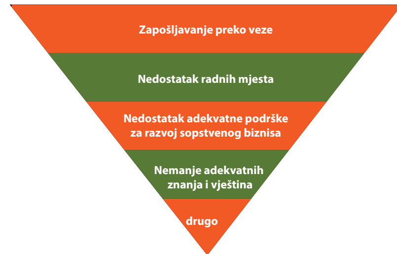
Grafik 7: Prikaz rangiranja problema prilikom pronalaska zaposlenja

Za potrebe ovog LAP, kroz upitnik koji smo sproveli među mladima, njih 52,2% smatra da će se lako zaposliti kad završi školu i fakultet. Upitani da ocijene šta smatraju najvećim problemom, rangirali su ih na sljedeći način: