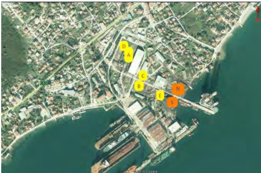
Slika 3. Prikaz brodogradilišta „Bijela“

Na slici 3 dat je prikaz brodogradilišta „Bijela“, sa depoima otpadnog grita, označeni od A do E, kao i neuređenim deponijama na sjeveru i jugu (N i S).