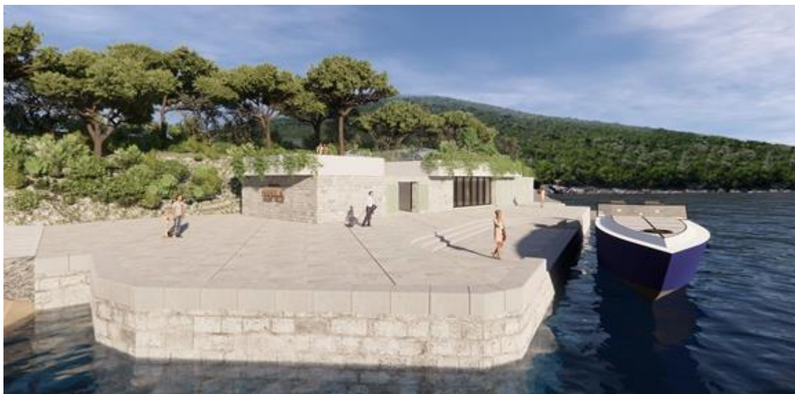
Slika 2. Izgled pristaništa po projektom, idejnom, rješenju.

Namjena pristaništa je veza kopna sa ostrvom Mamula. Projektno rješenje je urađeno u skladu sa težnjom investitora da maksimalno bude zadovoljena funkcionalna potreba nesmetane upotrebe pristaništa. To podrazumijeva povećan kapacitet pristaništa, ali bez proširenja površina. Takođe, projektom se omogućava pristupačnost objektu za kolski saobraćaj uključujući i racionalne kapacitete za mirujući, kolski saobraćaj (4 parking mjesta).