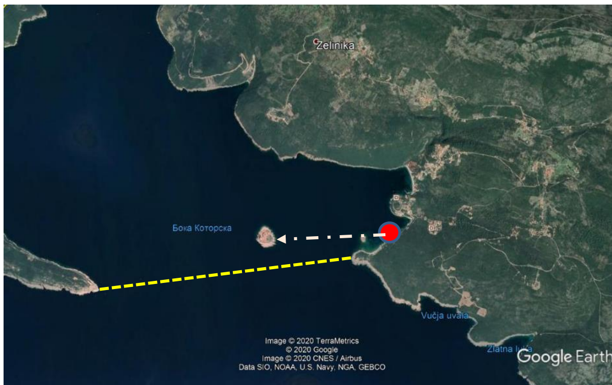
Slika 1. Položaj lokacije Mirište i pristaništa prema spojnici Bokokotorski zaliv – otvoreno more, ostrvu Mamula, ostrvu manastira Žanjice i stambenih aglomeracija Mirište i Žanjice

Lokacija uvale Mirište nalazi se neposredno iza rta Arza na Luštici, za koje se može reći da je prva unutrašnja „tačka“ Bokokotorskog zaliva, s njegove desne obale. Zamišljena linija rt Oštra, na istoimenom poluostrvu, kao produžetku poluostrva Kobila, i rta Arza jeste razdjelnica otvorenog mora i akvatorija Boke kotorske.